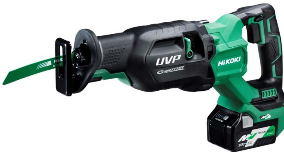
マルチボルトシリーズ 「コードレスセーバソー CR 36DA 形」